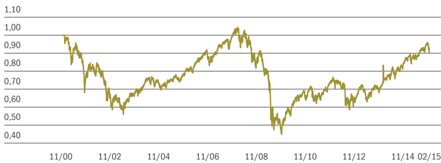
■ Pioneer – akciový fond